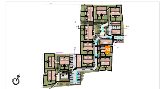
PLAN DE VENTE